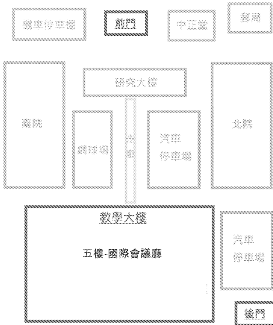
國立空中大學校園配置圖